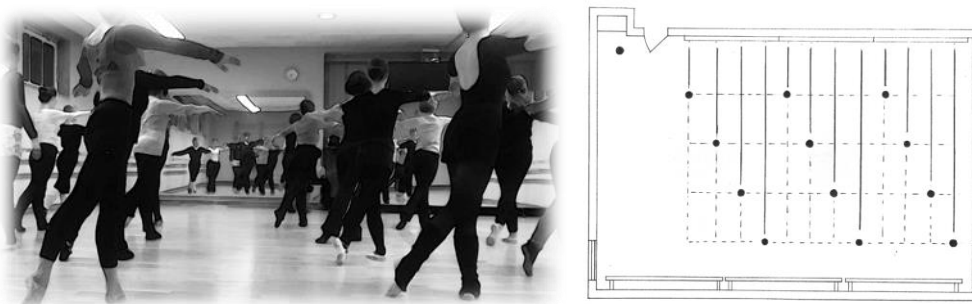
Abb. 2: Anordnung der übenden Körper während des „center“, aus der Sicht einer Kamera (links) und in schematischer Vogelperspektive (rechts).

Die Situation der Ballettstunde wird demnach zentral über eine klare zeitlich-musikalische sowie räumlich-materielle Ordnung aufrecht erhalten. Mit Goffman (1971:43) gedacht ist diese spezifische Ordnung dem „soziale[n] Anlass“ und also der Rahmung als ‚Übungssituation‘ geschuldet. Die anwesenden Körper werden auf eine Weise organisiert, die sie alle gleichzeitig und gleichmäßig als einzelne Körper bearbeitbar macht und sie vor wechselseitiger Behinderung oder physischer